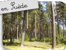
Forêt en Puède