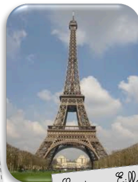
La tour Eiffel