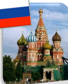
La cathédrale Saint-Basile en Russie