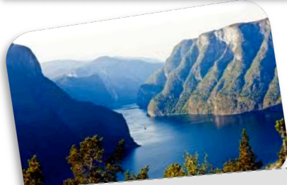
Les fjords en Norvège sont des vallées envahies par la mer.

Partout dans le monde, l'Europe est célèbre pour sa bonne cuisine avec des produits comme les fromages (qui viennent surtout de France, d'Italie et de Hollande), les vins (qui viennent de France, d'Italie et d'Espagne), les chocolats (qui viennent de Suisse et de Belgique).