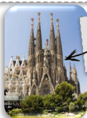
La Sagrada Família en Espagne